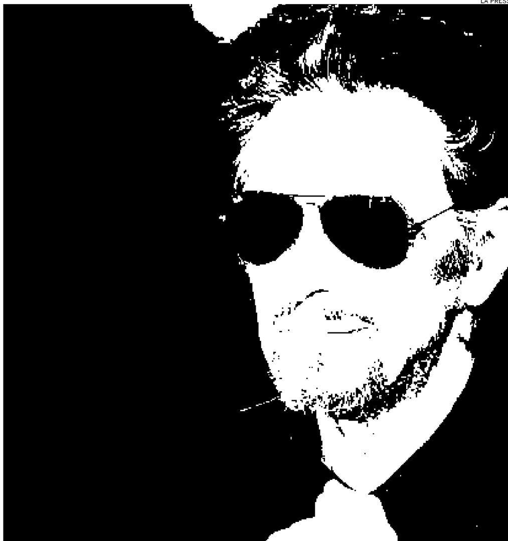
► Al Pacino ieri al Roma Film Fest

C'è anche il tempo per mettere un paletto tra la scena e la vita: «Gli attori recitano nella vita, mentre nell'arte perseguono la verità». Chiusura con aneddoto. Un grande attore, un po' più grande di lui, visto sul palcoscenico da giovane e, trent'anni dopo, nel rifare lo stesso testo: «Era infinitamente meglio da giovane. Cosa s'impara da ciò? Niente!». ■