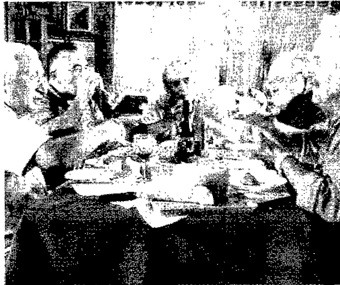
Una scena di “Il sol dell’Avvenire”

L'ufficio stampa del Festival si dissocia dalla proiezione della pellicola sul terrorismo rosso.